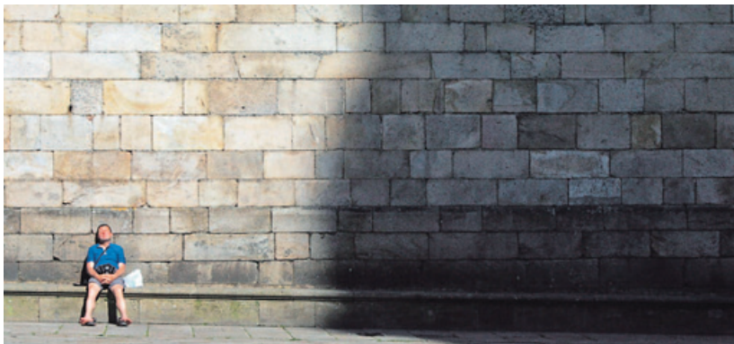
El sol y el calor (ayer, 25 grados en Santiago) darán paso a varios días fríos y húmedos. MÓNICA FERREIRÓS

ble por definición. Lo raro sería que el anticiclón se mantuviera tres semanas». Pero volverá, tras el frío paréntesis. Se le espera ya a mediados de la próxima semana.